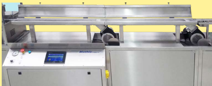
Canales de secado, panel con controlador Touch Screen

Proyectos de máquinas personalizadas de acuerdo con la necesidad del cliente, líneas piloto o de planta. Bajo consulta