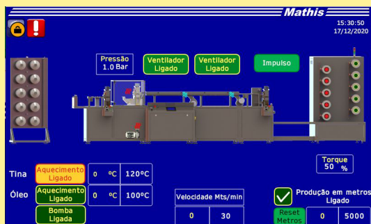
Controlador Touch Screen Opción para activar sólo mitad de las bobinadoras

* Material para rolos a ser definido conforme projeto