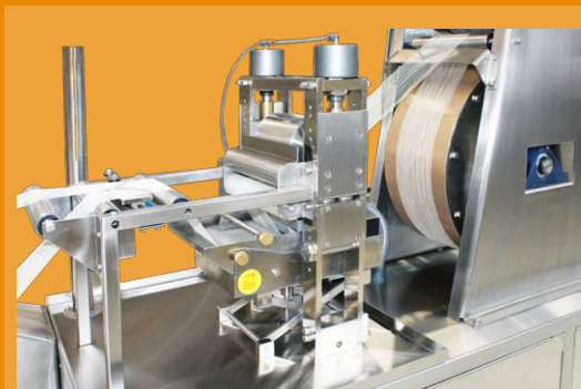
foulard de impregnación con tina calentada