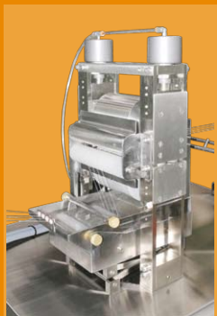
foulard de impregnación con tina calentada