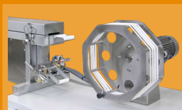
salida del tubo secador y aspa para hasta 4 hilos