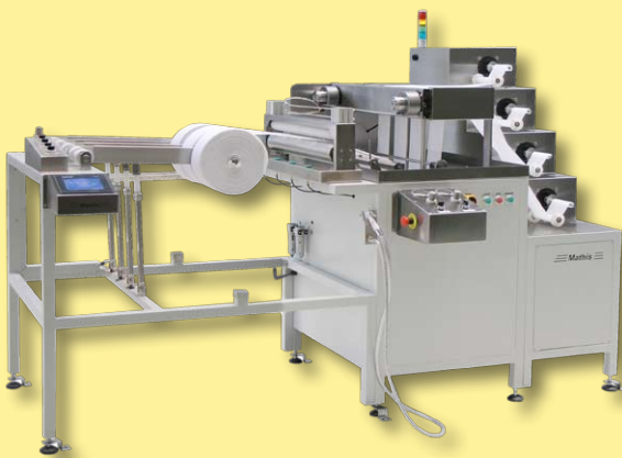
Máquina para impregnación de cintas de gasa curativas

Mathis realiza proyectos especiales bajo consulta, con anchos de rolo hasta 1m.