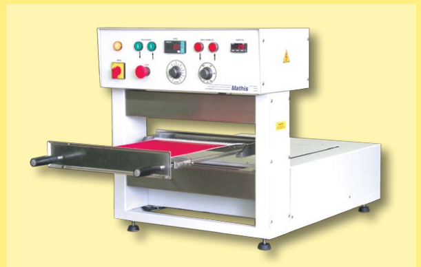
Vaporizadora y Rama Secadora de aire caliente para laboratorio - DH-e