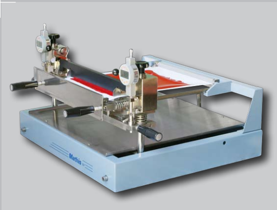
Equipo de laboratorio para revestimientos de raspado / espatulado - SV-B / SV-M-B