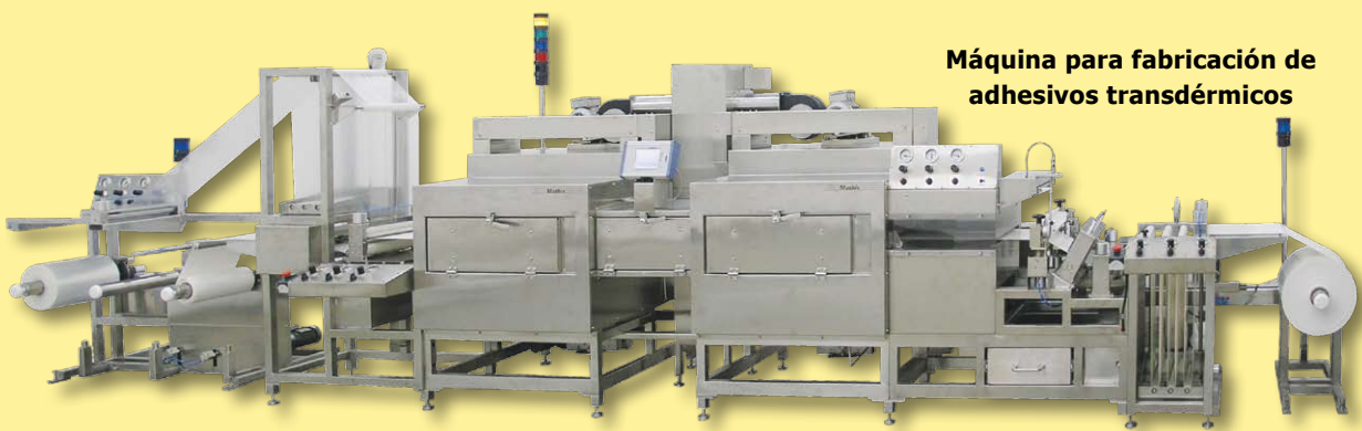
Máquina para fabricación de adhesivos transdérmicos