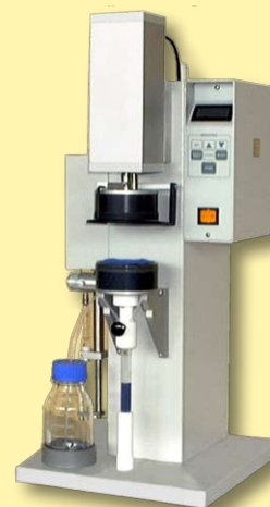
Extractor rápido de laboratorio usado para extraer productos a base de agua y solventes en minutos modelo Morapex S