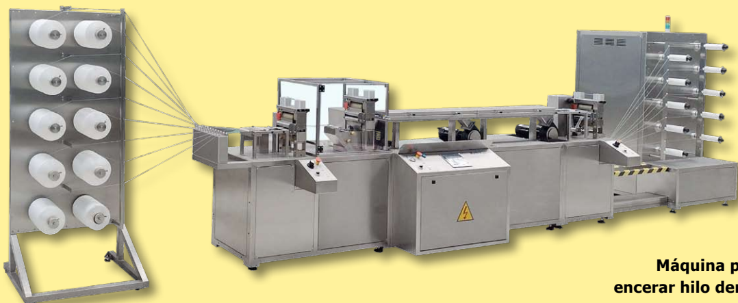
Máquina para encerar hilo dental

Mathis realiza proyectos especiales bajo consulta, con anchos de rolo hasta 1m.