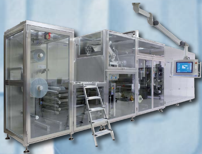
Máquina para Fabricación de Adhesivos Transdérmicos