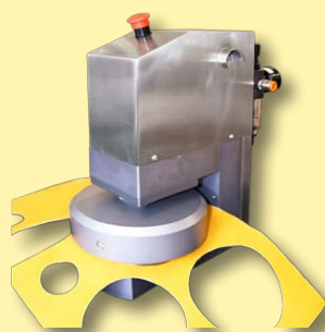
Cortador automático de pruebas circulares (diámetros de 44,5mm hasta 140mm).