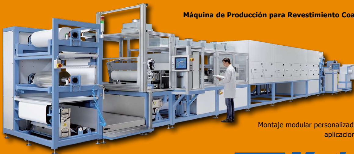
Máquina de Producción para Revestimiento Coating y Laminado

Montaje modular personalizada para las diversas aplicaciones de cada cliente