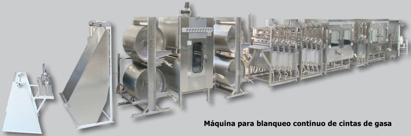
Máquina para blanqueo continuo de cintas de gasa