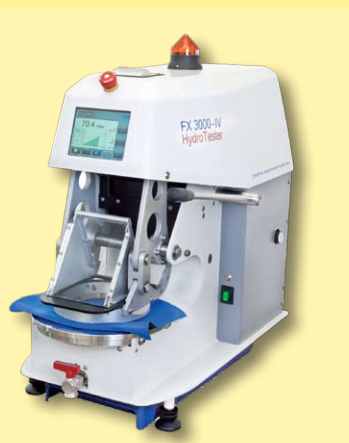
Equipo para ensayo de columna de agua hydrotester modelo FX-3000 IV Textest AG