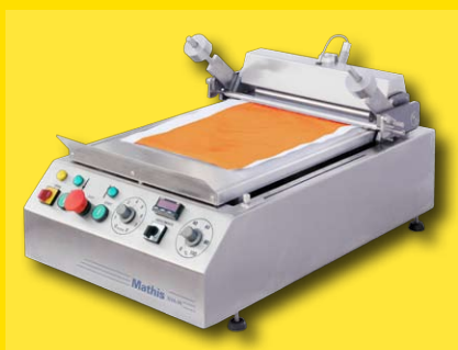
Equipamento de laboratório para espatulagem em papel - SVA-B (opcional: com pré-secagem IR)