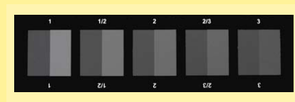
escala de cinzas - norma ISO 105 A02 para avaliação de alteração de cor (desboto)