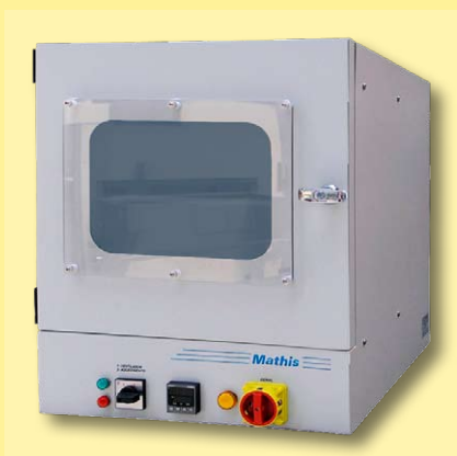
OPCIONAL: forno FOR-B com circulação de ar quente para secagem de amostras em perspirômetro