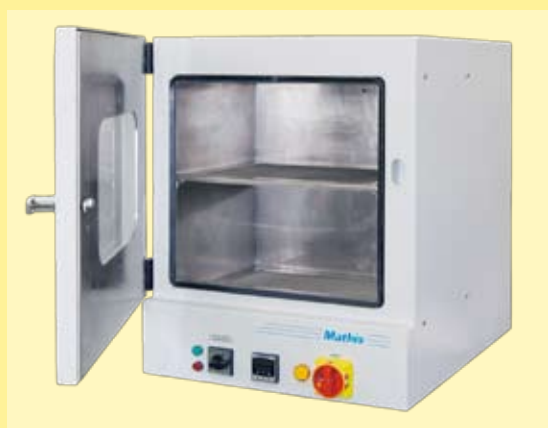
Estufa modelo FOR-B com bandeja para secar amostras (Para colocar perspirômetro PTE-B, remover a bandeja.)