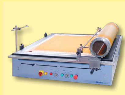
cilindro com barra eletromagnética